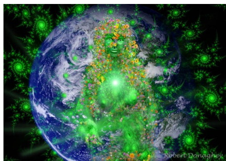
Gaïa, Déesse Terre-Mère

Croire est le préalable à l'action. Changeons nos croyances collectives et nous changerons nos projets et nos actes collectifs. C'est en fait fort simple et c'est le rôle de Dieu Arbre de Vie.